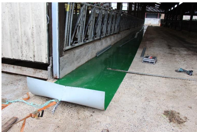
Fixer une extrémité et tendre à l'aide d'une pince et d'une sangle à cliquet