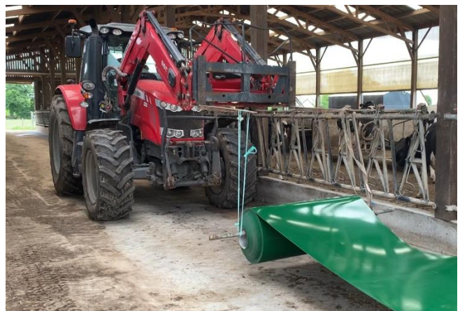
Dérouler la toile