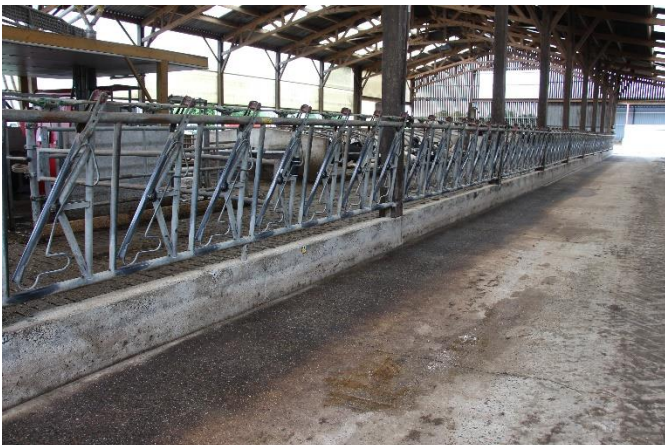
Préparer le support au nettoyeur haute pression