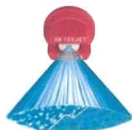
À pression de 1 bar (15 PSI) À pression de 4 bar (60 PSI)