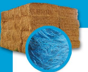
Conditionnement des fourrages, palissage vigne et horticulture