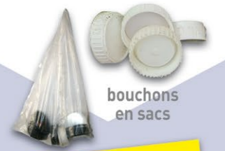
bouchons en sacs