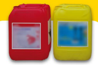
Produits d'hygiène de l'élevage laitier