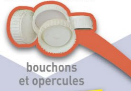
bouchons et opercules