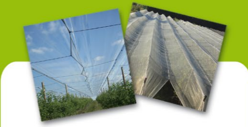
Protection des cultures arboricoles