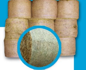
Conditionnement balles rondes