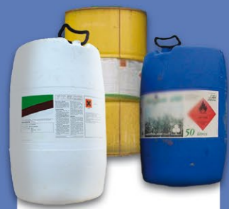
Produits phytopharmaceutiques et fertilisants