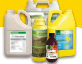
Produits phytopharmaceutiques et fertilisants