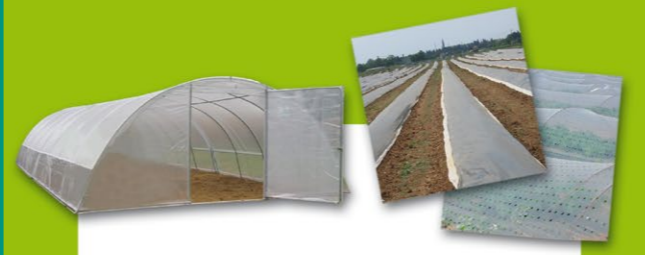
Couvertures de serres