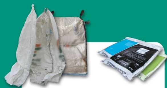
Engrais, amendements, semences et plants