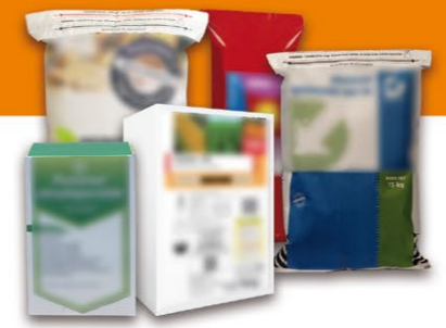
Produits phytopharmaceutiques et fertilisants